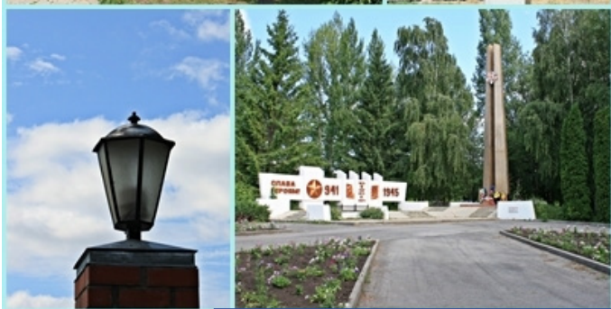
г.Елец Липецкой области