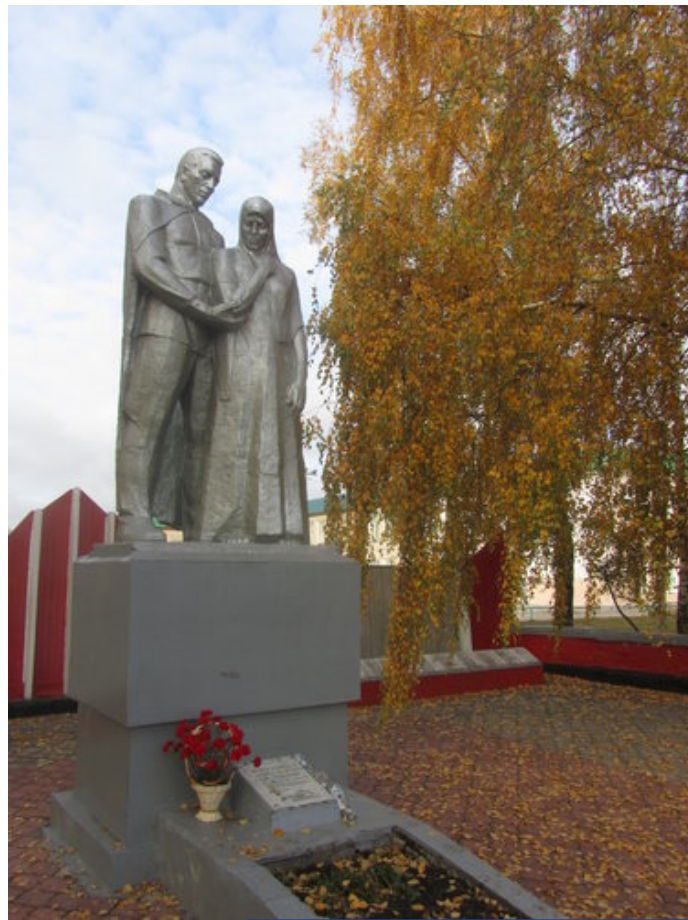
с.Измалково Липецкой области

Нет памятников — нет ограничителей, которые препятствуют новым трактовкам истории, которые противостоят изменениям в общественном мнении о России, выгодным для политиков в Европе и США.